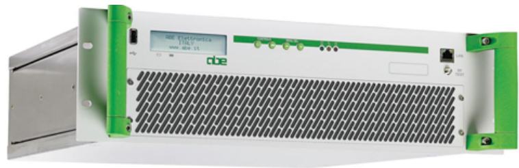
MTX в стойке типа Rack 19"